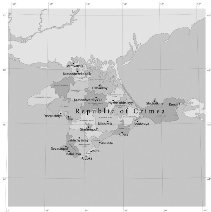
Figure 2. The Republic of Crimea's political map